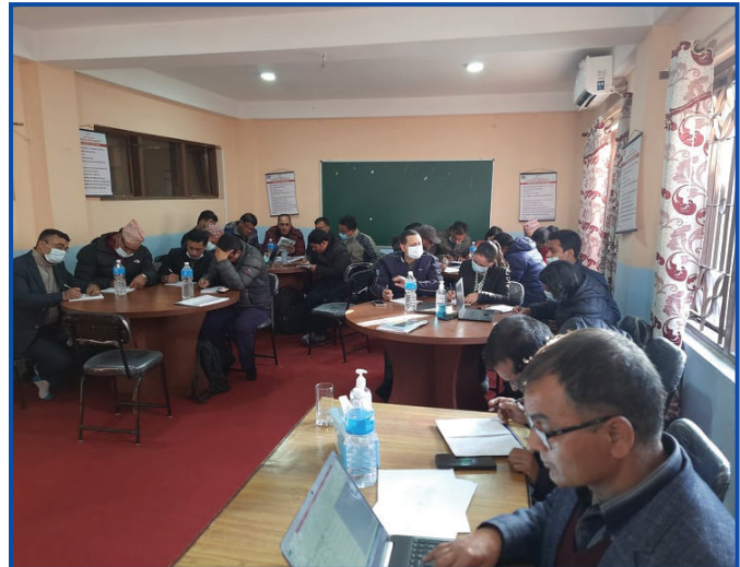
स्थानीय तहका शिक्षा अधिकृतहरूको स्थानीय पाठ्यक्रम विकास सम्बन्धी कार्यशालाका सहभागीहरू