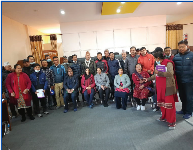
स्वास्थ्य शिक्षकहरूको तालिमका सहभागीहरू