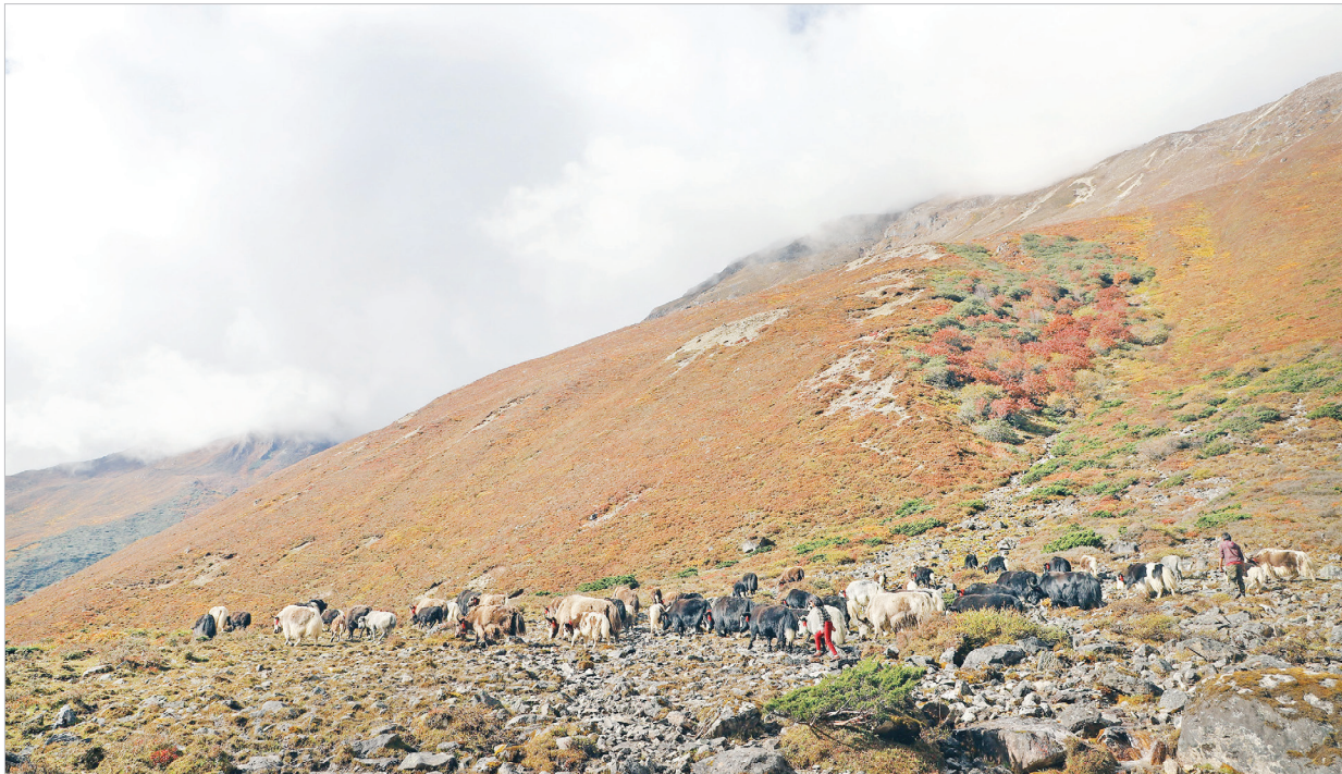
चार हजार दुई सय मिटर उचाइमा अवस्थित ताप्लेजुङको फलाङलुङ गाउँपालिका-७ स्थित मौवाटारका किसान याकलाई चरन क्षेत्रतर्फ लैजाँदै ।

एक साता लामो भ्रमणका क्रममा प्रधानमन्त्री देउवाले नेपालको तर्फबाट सम्मेलनमा आफ्ना मुद्दाहरू प्रस्तुत गर्नुहुनेछ । साथै भ्रमणका क्रममा विभिन्न मित्रराष्ट्र मुलुकका समकक्षी तथा उच्चाधिकारीसँग भेटघातौं समेत गर्नुहुनेछ ।