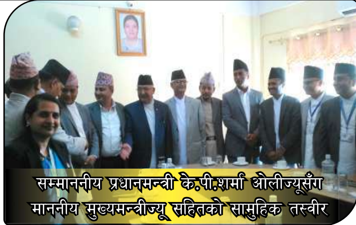
सम्माननीय प्रधानमन्त्री के.पी.शर्मा ओलीज्यूसँग माननीय मुख्यमन्त्रीज्यू सहितको सामूहिक तस्वीर