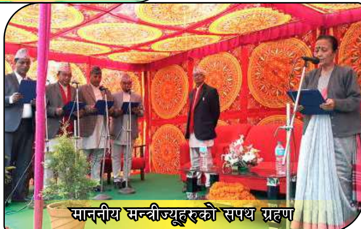
माननीय मन्त्रीज्यूहरूको सपथ ग्रहण