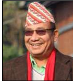
माननीय दावा दोर्जे लामा मन्त्री

भूमि व्यवस्था, कृषि तथा सहकारी मन्त्रालय