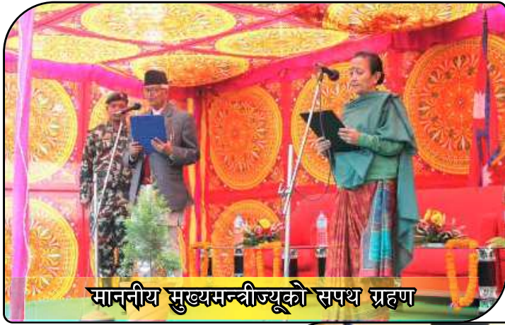
माननीय मुख्यमन्त्रीज्यूको सपथ ग्रहण