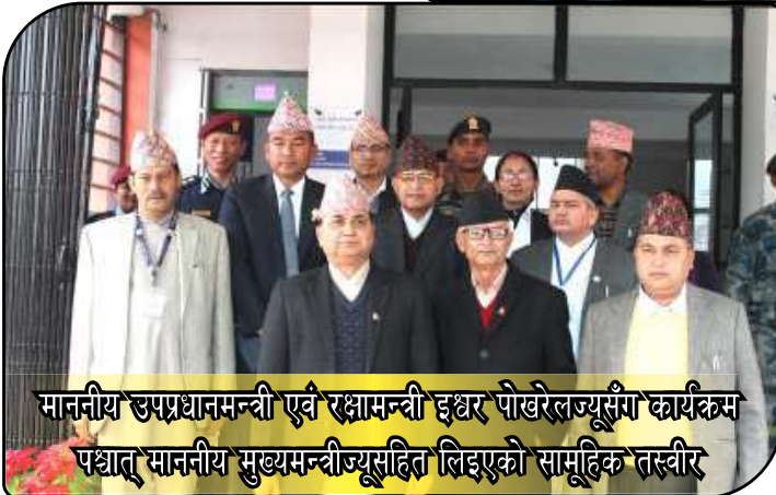
माननीय उपप्रधानमन्त्री एवं रक्षामन्त्री इश्वर पोखरेलज्यूसँग कार्यक्रम पश्चात् माननीय मुख्यमन्त्रीज्यूसहित लिइएको सामूहिक तस्वीर