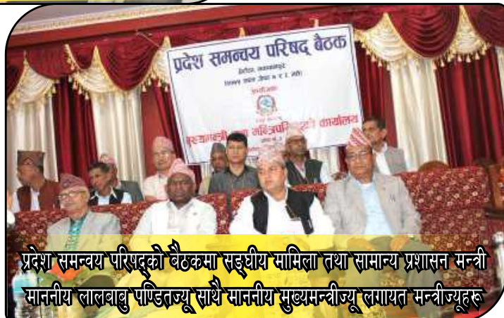
प्रदेश समन्वय परिषद्को बैठकमा सङ्घीय मामिला तथा सामान्य प्रशासन मन्त्री माननीय लालबाबु पण्डितज्यू साथै माननीय मुख्यमन्त्रीज्यू लगायत मन्त्रीज्यूहरु