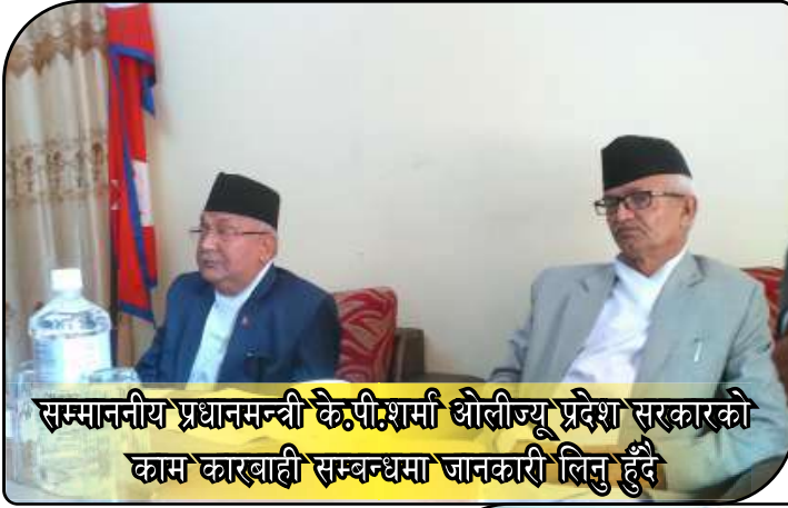
सम्माननीय प्रधानमन्त्री के.पी.शर्मा ओलीज्यू प्रदेश सरकारको कार्यमा कारवाही सम्बन्धमा जानकारी लिनु हुँदै