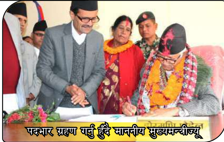
पदभार ग्रहण गर्नु हुँदै माननीय मुख्यमन्त्रीज्यू