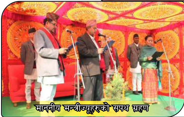
माननीय मन्त्रीज्यूहरूको सपथ ग्रहण