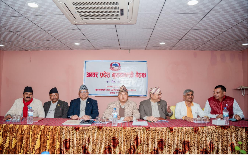
अन्तरप्रदेश मुख्यमन्त्री बैठक, बागमती प्रदेश, हेटौँडा (मिति २०८०/०९/१३)