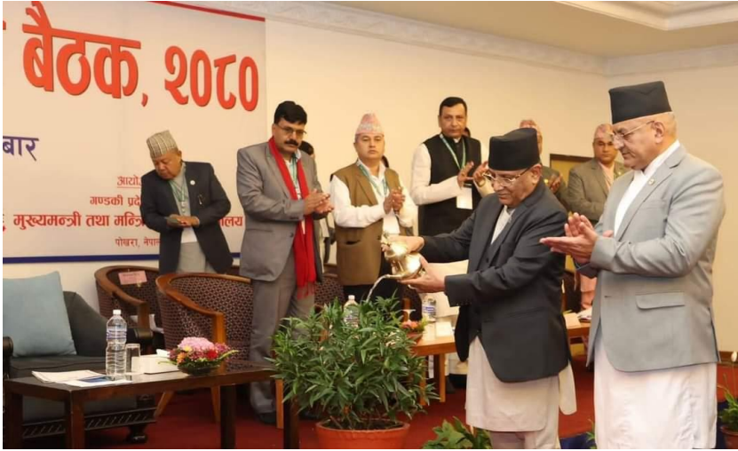
अन्तरप्रदेश मुख्यमन्त्री बैठक, गण्डकी प्रदेश, पोखरा (मिति २०८०।०३।१५)