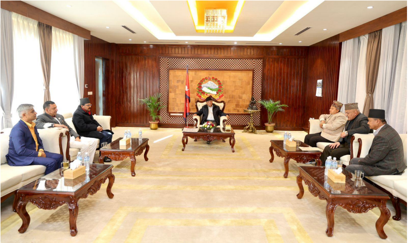
अन्तरप्रदेश मुख्यमन्त्री बैठक, हेटौँडाको निर्णय सम्माननीय प्रधानमन्त्रीज्यू समक्ष प्रस्तुत गर्दै मा. मुख्यमन्त्रीज्यूहरू (मिति २०८०/०९/१४)