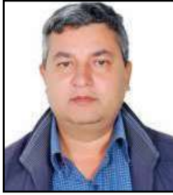
माननीय शालिकराम जम्कट्टेल मन्त्री