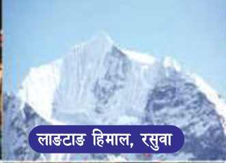
लाङटाङ हिमाल, रसुवा