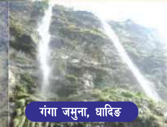
गंगा जमुना, धादिङ

नेपाल भ्रमण वर्ष २०२० मा तपाईंलाई बागमती प्रदेशमा हार्दिक स्वागत छ ।