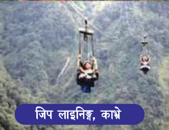
जिप लाइनिङ्ग, काभ्रे