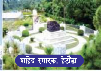
शहिद स्मारक, हेटौडा