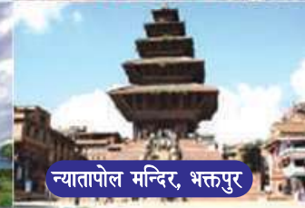
न्यातापोल मन्दिर, भक्तपुर